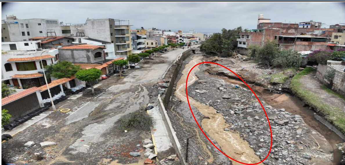
Imagen N° 1. Tramo de la quebrada chullo que se encuentra colmatado en su caja hidráulica debido al evento extraordinario; causando daño en las viviendas cercanas al cauce.