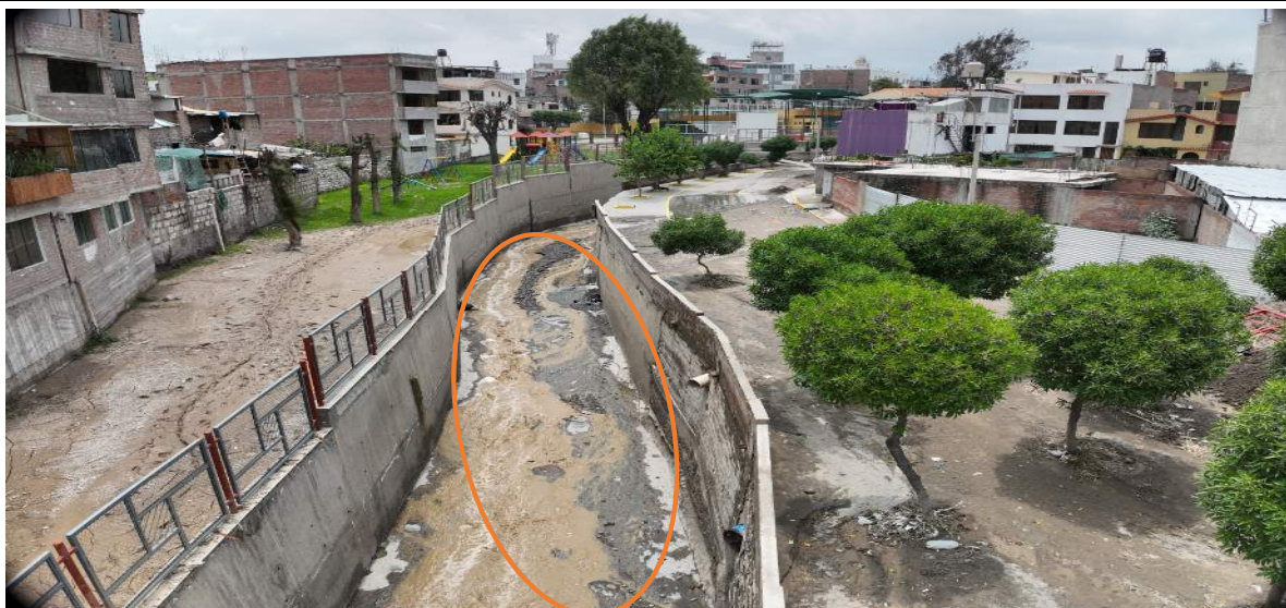
Imagen N° 2. tramo de la quebrada chullo que se encuentra colmatado en su sección hidráulica.